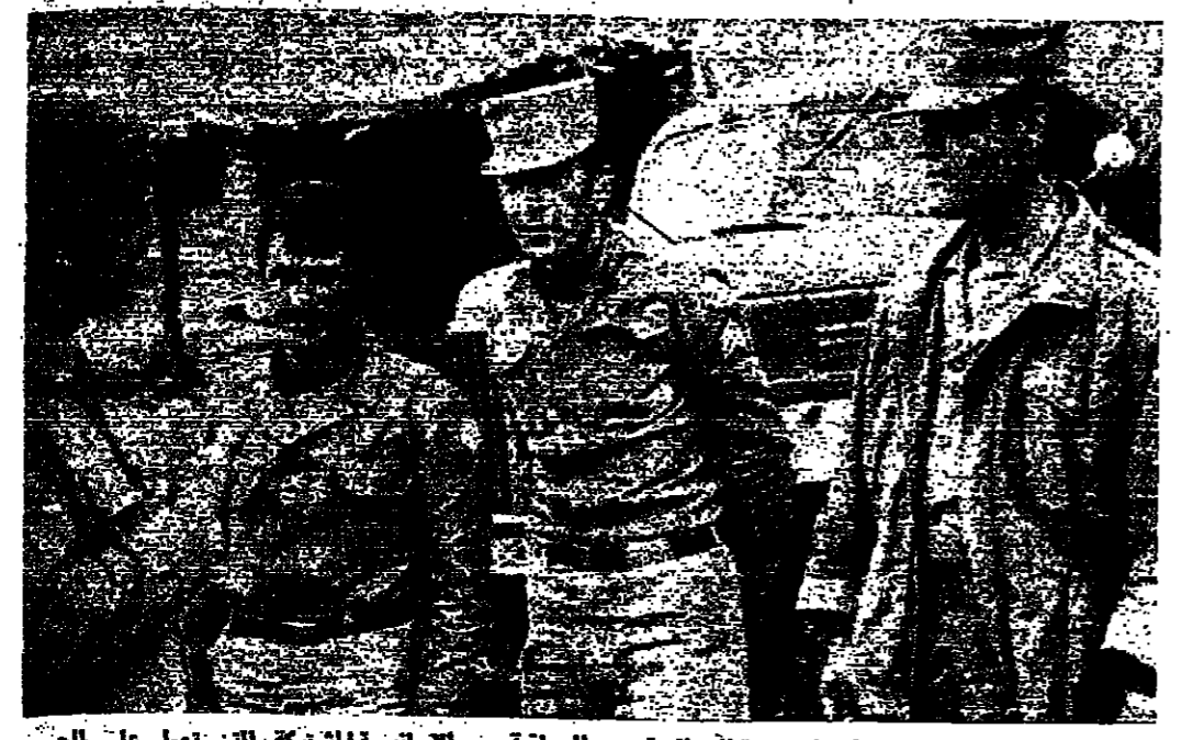
أول صورة للجنة العسكرية الجزائرية - العراقية - الإيرانية المشتركة التي تعمل على التوصل إلى اتفاق